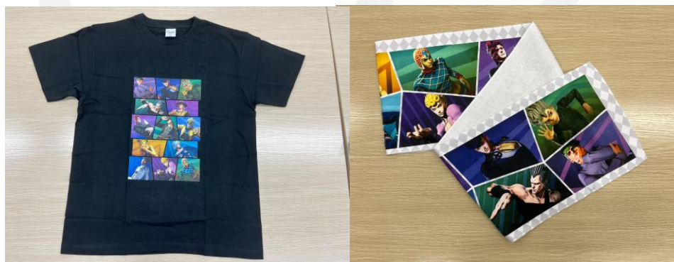
「ジョジョの奇妙な冒険」