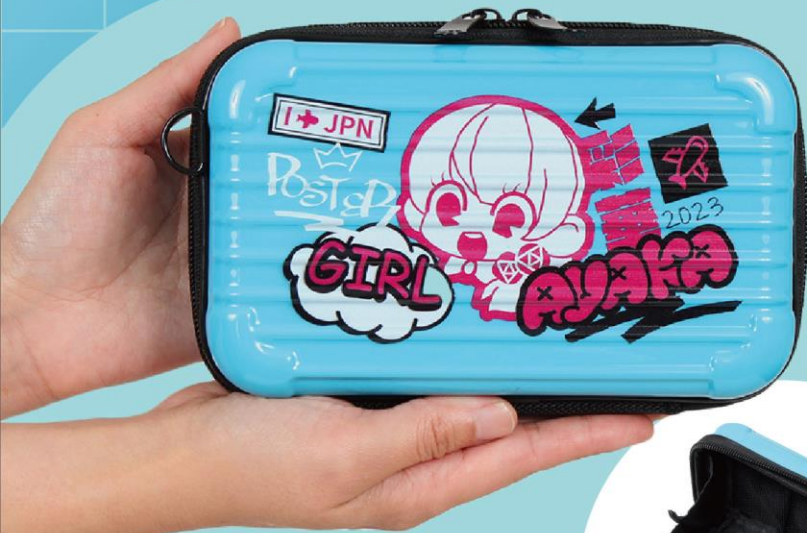
ミニトランク型ポーチ