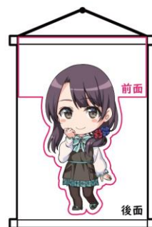
前面ダイカット仕様 前面のキャラクターの形状に合わせて形状など自由カット