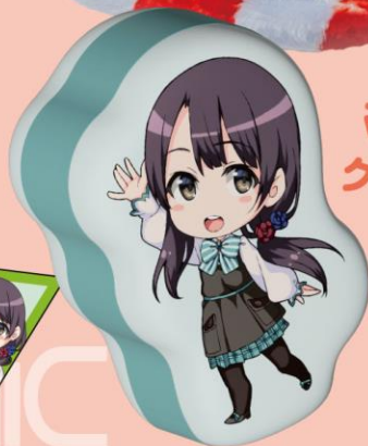
マチ付き クッション