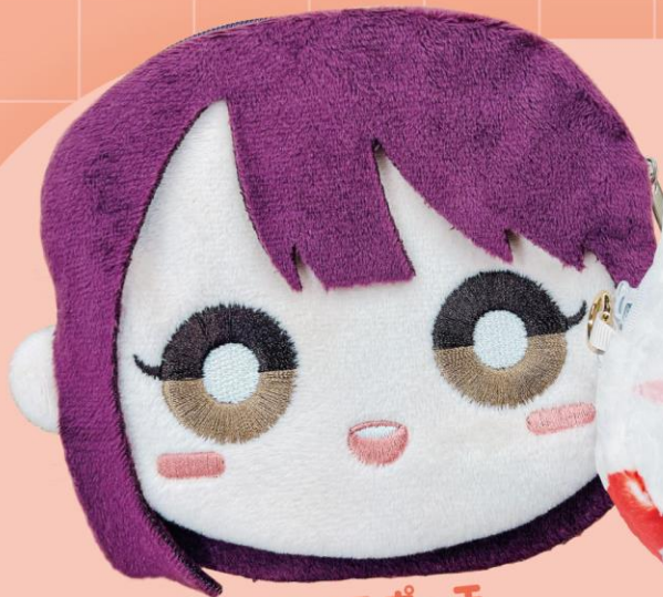
キャラフェイスポーチ