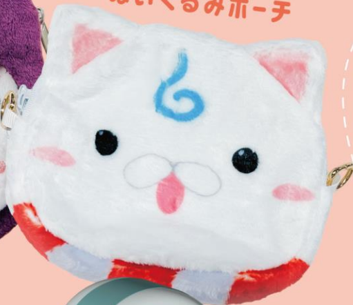
ぬいぐるみポーチ