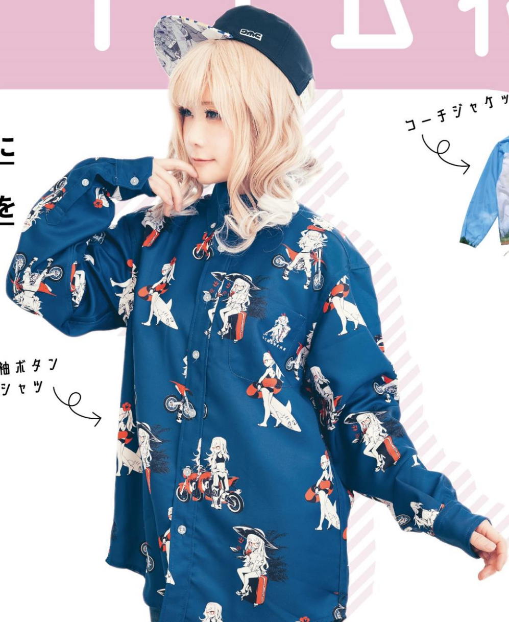
長袖ボタン シャツ