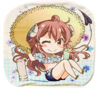
▲ダイカットクッションカバー