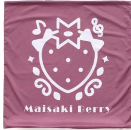
▲スクエアクッションカバー