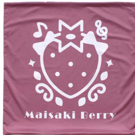
◀クッションカバー

過去に「ゆるキャン」の案件にて 寝袋入りクッションとして製作した実績がございます。